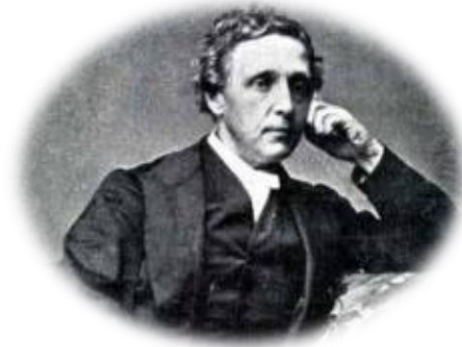
Льюис Кэрролл «Алиса в стране чудес»

«Нужно бежать со всех ног, чтобы только оставаться на месте, а чтобы куда-то попасть, надо бежать как минимум вдвое быстрее!»